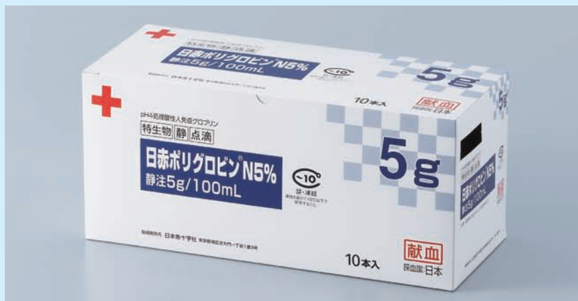
日赤ポリグロビンN5%静注5g/100mL