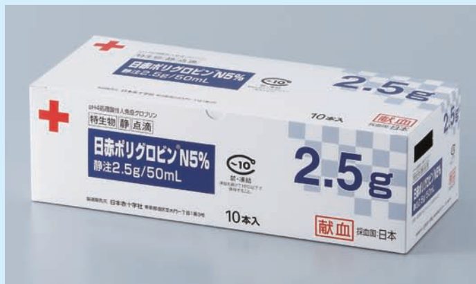
日赤ポリグロビンN5%静注2.5g/50mL