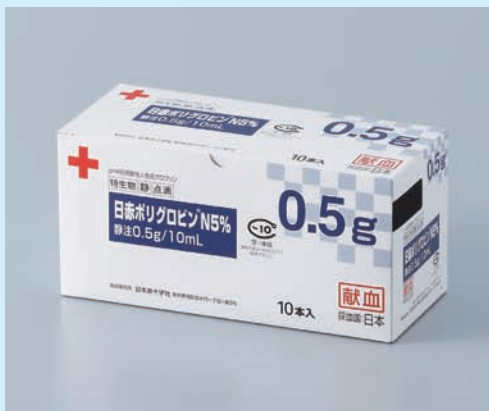
日赤ポリグロビンN5%静注0.5g/10mL