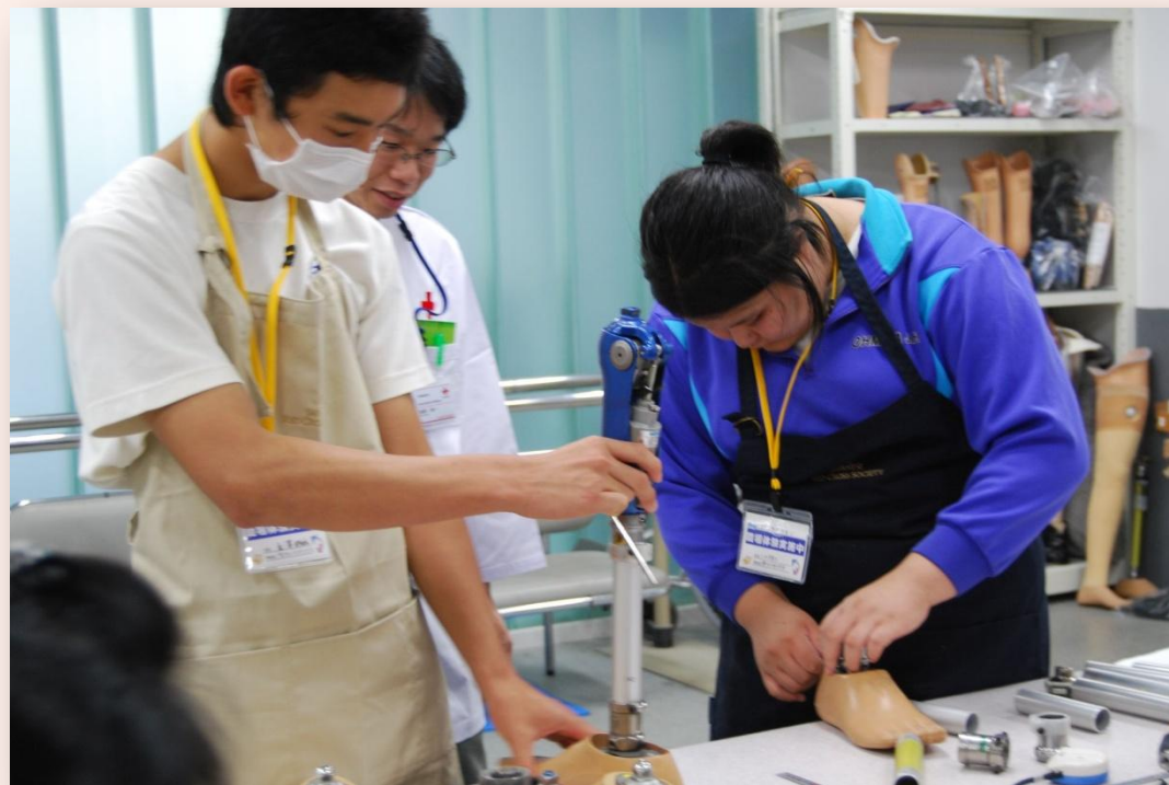
中学生が義肢製作体験学習 【千葉県支部義肢製作所】