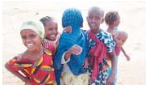
過酷な環境の下でも明るい子どもたち

都ナイロビでも水不足に。今年3~5月の雨期にガルバチュウラには一滴の雨も降りませんでした。干ばつの影響で作物が育たず、食料不足も深刻です。