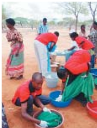
蚊帳への防虫剤の再塗布作業を行う赤いシャツを着たボランティア

これに対してIHOPは、現地の問題を彼ら自身で解決することを目標にした事業。赤十字ボランティアと地域保健員の87人はすべて、IHOP事業地のガルバチュウラ県内にある17の村々から選ばれました。彼らは水と衛生に関するトレーニング、救急法、医療保健教育などを受けています。