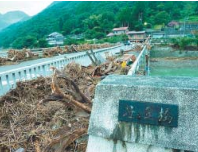
大量の流木が橋の上に重なる（兵庫県）

戦時中、日本赤十字社救護班要員として中国で救護活動に従事。戦後は宮城県の石巻赤十字高等看護学院教務主任、東北公済病院看護部長、日本看護協会理事、岩手女子看護短期大学教授などを歴任。現在も教鞭をとるかたわら、東北大学大学院の研究生として新人看護師の離職防止などの研究に取り組んでいる。84歳。