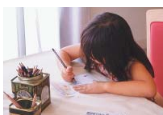
心を込めて絵手紙を描く来場者(愛知)