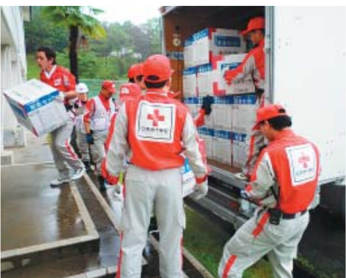
佐用中学校救護物資搬入