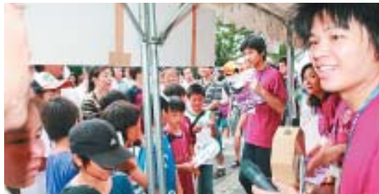
赤十字事業啓発イベントで 抽選をする地区職員

京都サンガFC 応援キャンペーン サポーター19500人の前で 赤十字をPR 京都