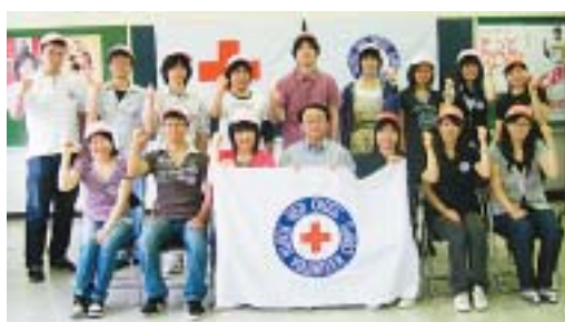
これからの活動に意欲を燃やす学生の皆さん

イーハトーブ学生赤十字奉仕団(45人)と岩手大学学生赤十字奉仕団(6人)の合同結団式が7月18日、岩手県赤十字会館で開催され、両団から15人が参加しました。