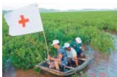
植林されたマングローブの保護活動を行う地域住民・赤十字ボランティア

日本赤十字社の支援でベトナム赤十字社が取り組むマングローブ(海岸湿地帯の植物)植林事業。このほどベトナム赤十字社のトラン・ゴクタン