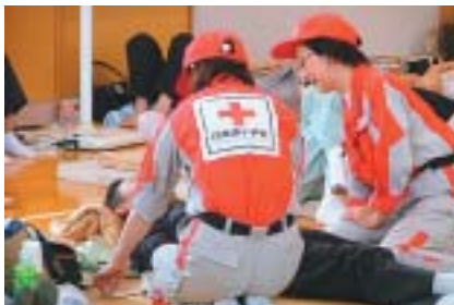
避難所で健康状態を聞く（山口県）

中国・九州北部豪雨に続いて、台風第9号による大雨が兵庫県などに大きな被害をもたらした。さらに震度6弱の地震が静岡に――今年の夏は自然災害が各地で相次ぎました。日本赤十字社は全国のネットワークを生かした被災者支援を全力で展開しました。7月21日の中国・九州北部