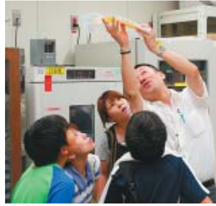
成分献血後の黄色い血小板製剤を見学

教室は、赤十字安全水泳奉仕団、青年赤十字奉仕団との共催。家族で水の事故防止の知識と技術を習得してもらうことを目的に毎年開催しています。