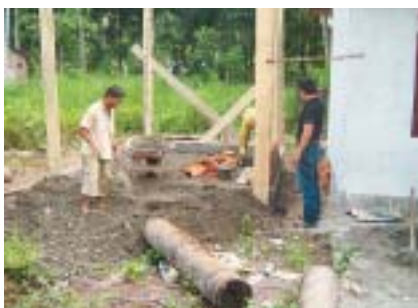
建設地の提供や、建設作業員の選出、材料の調達や価格交渉など、村人が中心となって、ポスコは建てられる

インドネシア赤十字社のナガンラヤ県支部では、2007年から今年3月までに130人のボラ