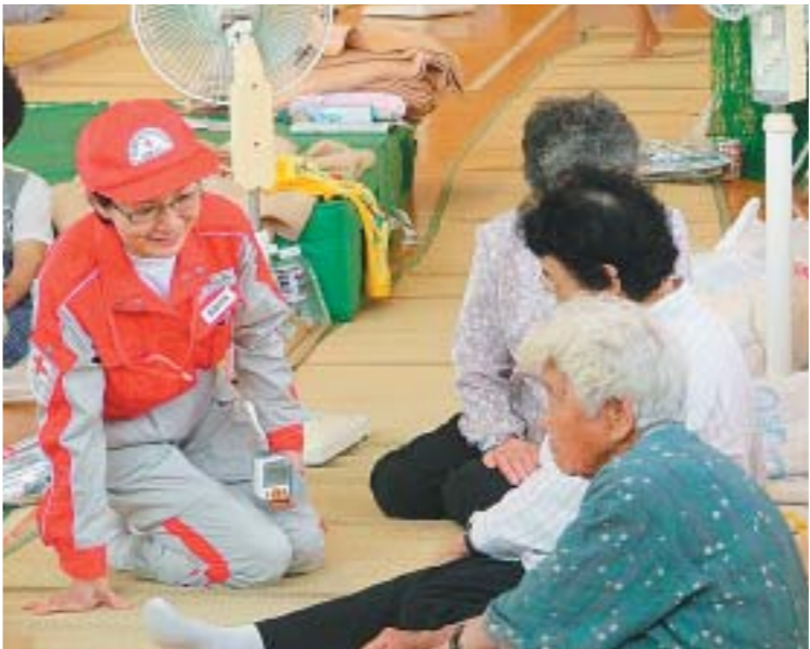
災害現場でこころのケアに取り組む救護員