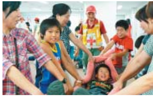
毛布を使って搬送体験