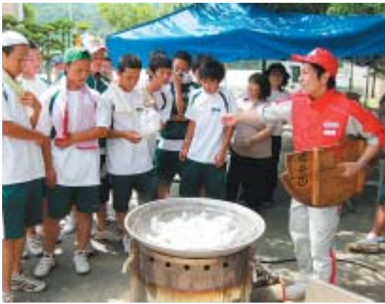
水代わりのお茶やコーヒーで炊飯に挑戦

「パンストや新聞紙で応急手当ができる」とは知らなかった。「もしもの時に役立つようにしたい」などの感想が出されました。