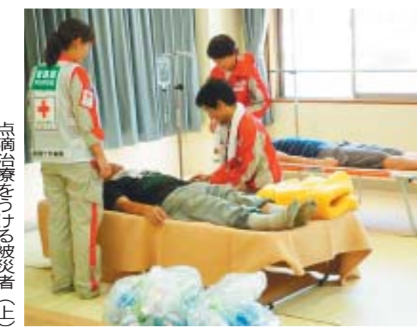
近隣支部から医療支援

8月9日、日本に接近した台風第9号による豪雨で兵庫県北西部に位置する佐用町(佐用郡)、宍粟市や豊岡市など甚大な被害が発生しました。兵庫県支部では災害対策本部を設置し、救護班の派遣や救護物資の配付、さらには地域奉仕団による炊き出しなど被災者救援に取り組まれました。 即座に届けた救護物資 この豪雨による兵庫県内の死者行方不明者は22人、全半壊1105戸、床上浸水349戸、床下浸水1664戸(8月26日兵庫県発表)など深刻な被害状況となっています。兵庫県支部では、大雨洪水