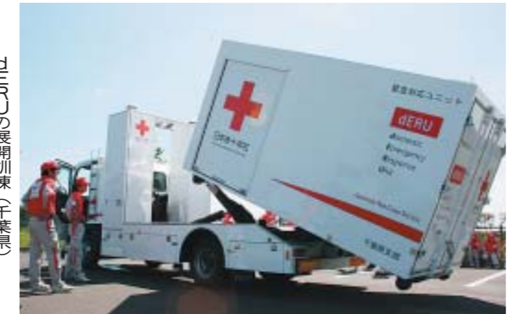
dERUの展開訓練(千葉県)

大規模地震災害などが発生した場合、被災地に仮設診療所を設置するために開発されたのがdERU(Disaster Emergency Response Unit)です。 …国内型緊急対応ユニットです。昨年度末までに全国15カ所の本社・支部に配備されています。今年度から年度末それぞれ2支部ずつ整備を進めます。 大規模地震災害などが発生した場合、被災地に仮設診療所を設置するために開発されたのがdERU(Disaster Emergency Response Unit)です。 …国内型緊急対応ユニットです。昨年度末までに全国15カ所の本社・支部に配備されています。今年度から年度末それぞれ2支部ずつ整備を進めます。