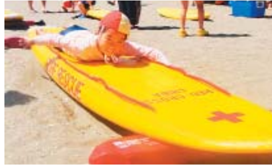
10回目となったジュニアライフセービング教室。レスキューボードを体験

千葉県支部は7月26日、千葉市美浜区いなげの浜で赤十字ジュニア・ライフセービング教室を開催。18人の親子が