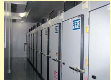
新鮮凍結血漿(FFP)の貯留保管庫

また、輸血前後の感染症検査の徹底により、リスクの高い血液をより有効に除外することができるようになります。