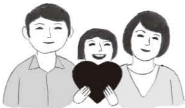
市町村を通じて100%全額 被災された方々へ