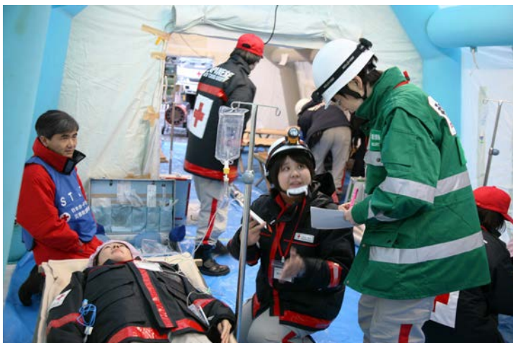
実働訓練 3（現場救護所）