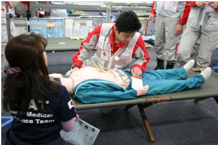
現場救護所での実習