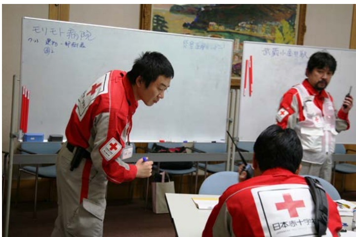
無線連絡対応の実習