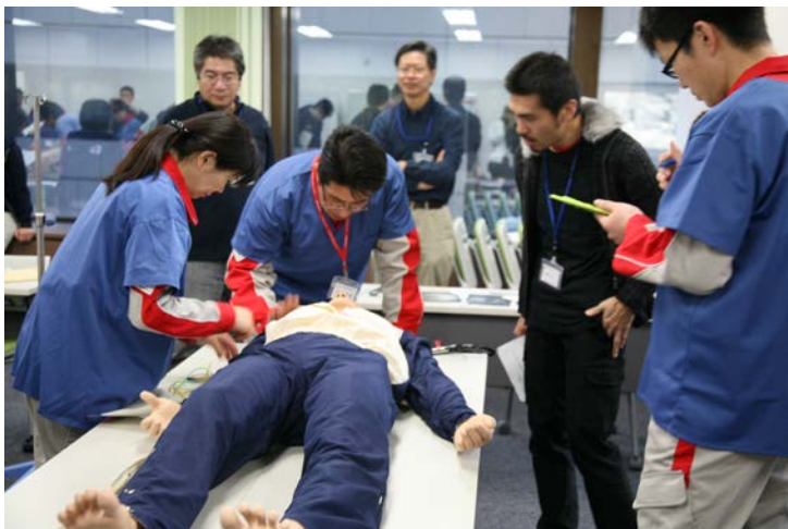
災害拠点病院での実習（搬送可能状況確認）