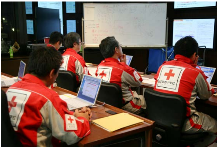
災害時の通信確保について実習