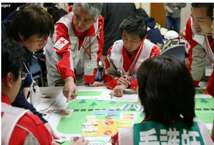
机上シミュレーション（現場救護所）