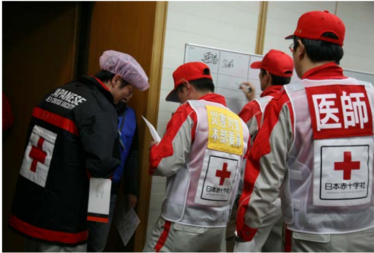
実働訓練（救護所活動）