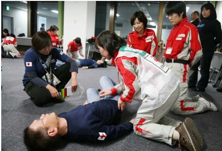
災害時の外傷対応について実習