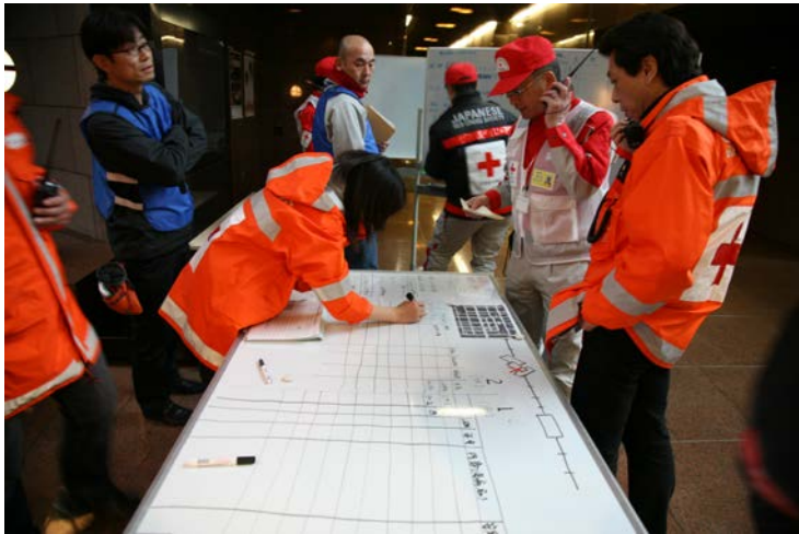
実働訓練 2（現場救護所）