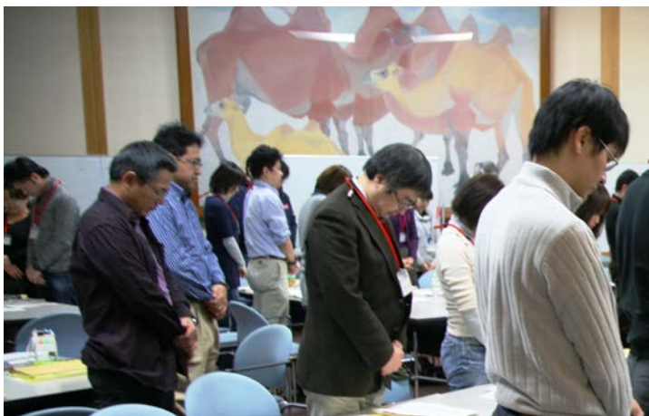
参加者全員による阪神淡路大震災の 犠牲者への黙祷（1/17）