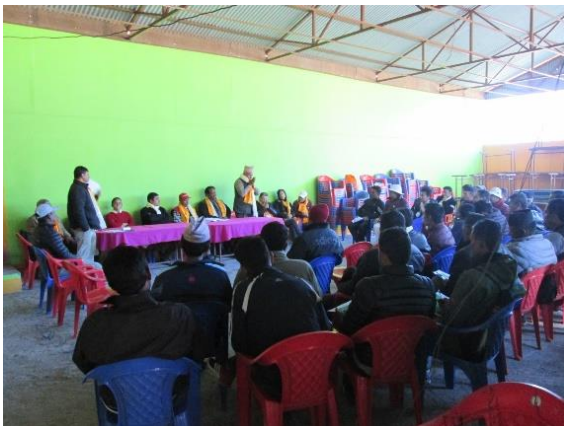
2016年12月にシンドパルチョーク郡の住民や行政職員対象に開かれた日赤の復興支援活動説明会の様子

ネパール赤十字社は、被災地の復興および被災者の生活再建を目指し、①住宅再建、②生計支援、③水と衛生、④保健の4つの分野を活動の根幹と決めました。それら4つの分野にネパール赤十字社の組織強化を加え、ネパール復興支援は「4 + 1（フォー・プラス・ワン）」と呼ばれる活動が中心となっています。