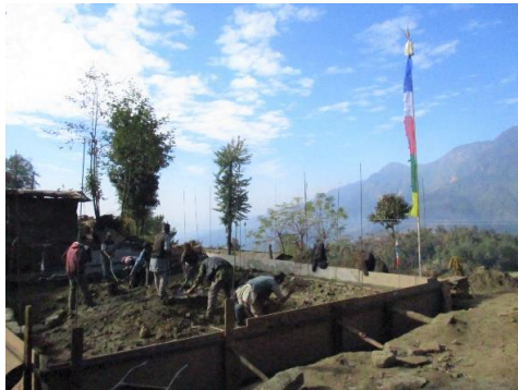
資材運搬費は山村に暮らす人々にとって大きな負担

ネパール政府は、住宅再建にあたり、地元で手に入る石やがれきを資材として活用することを奨励しています。しかし、住宅の倒壊で家族を亡くした人々のなかには、辛い経験を思い起こすがれきとは別の資材を探し求める人もいます。また、石材を用意するための労力や道具が不足しているために、石材よりも高価なレンガを遠方から調達せざるをえない人もいます。そして、日赤の事業地のような山村に暮らす人々にとっては、資材の運搬費も大きな負担になっています。