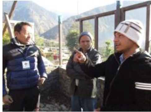
住宅再建巡回指導の様子

復興支援活動の中で、最も大きな取り組みの一つが住宅再建支援です。ネパール政府は、各国の援助機関等の支援を受け、対象世帯を認定したうえで、住宅再建のための補助金を支給することを決めています。日赤は、シンドパルチョーク郡内の2村（タンパルダップ村、タンパルコット村）の約1500世帯を対象に、補助金の支給を支援しています。