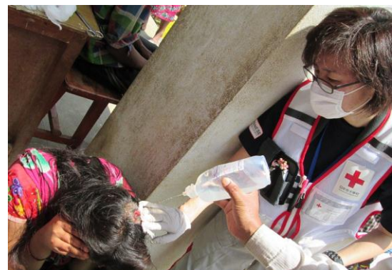
メラムチ村で先遣隊要員が患者を診療している様子