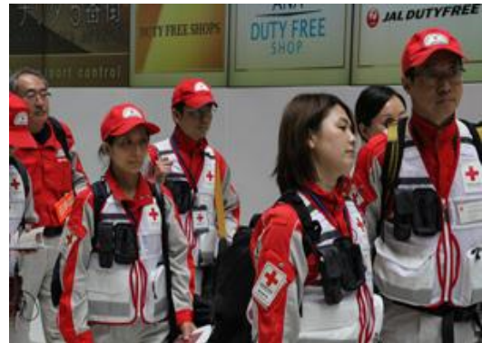
成田空港からカトマンズに向けて出発する保健医療チーム