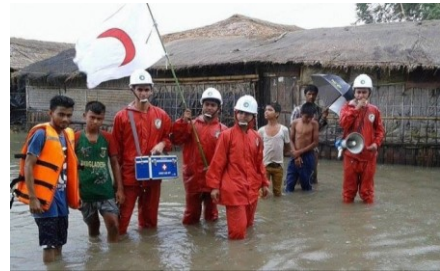
サイクロン「ロアヌ」(2016)。5万5,260人のバンラデシュ赤新月社ボランティアがサイクロン襲来前に村落を回り、洪水への備えを周知するとともに、50万人以上の人々を安全に避難させた。

例えば、子どもや高齢者、妊産婦、障がいのある人などは災害時に特に弱い立場に置かれる人々であることが広く知られています。また、災害で真っ先に犠牲になりやすいのも、常にこうした人々だと言われています。災害が多発する日本に暮らす私たちは、これを直感的に知っていると言って良いのかもしれませんが。一方で、 日本での生活の中で、気候変動の影響を感じているのは、農業や畜産業といった一次産業に従事されている方が多い かもしれません。